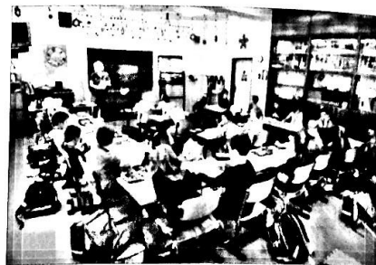
Skupina žáků ve třídě

Člověk je tvor společenský. Žije ve společenství druhých lidí . Ve společnosti zastává různé role . Je například synem nebo dcerou svých rodičů, může být vnukem či vnučkou, bratrem nebo sestrou. Každý člověk je také obyvatelem své obce a občanem své vlasti. Svou roli má každý žák ve třídě, ve škole, dospělý v zaměstnání apod. Lidem, kteří spolu tvoří nějaké společenství , říkáme sociální skupina . Aby taková skupina lidí mohla bez problémů fungovat, musí její členové dodržovat určitá pravidla . Ta mohou být jasně daná (např. zákony České republiky) nebo si je mohou členové skupiny vytvořit (např. pravidla chování v rodině).