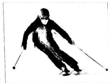
Ochranné pomůcky při jízdě na lyžích

Život člověka ohrožují různé nemoci a úrazy . Mnoha nemocem i úrazům je možné předcházet . Při některých sportech klademe důraz na používání ochranných pomůcek – např. přilby, chráničů kolen, loktů a páteře. Při sportech, ale např. i při přecházení silnice nemáme zbytečně riskovat .