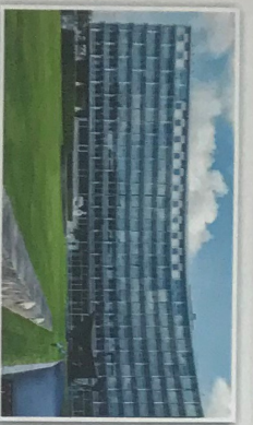
Obr. 1 – Sídlo UNESCO v Paříži