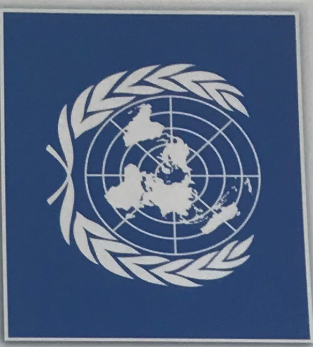
Obr. 1 – Vlajka OSN

• Lidé, kteří k nám přišli za prací, často vykonávají pracovní pozici neodpovídající jejich vzdělání (např. učitelé vykonávají výzkumné práce apod.).