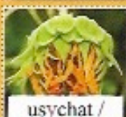
usychat / usýchat